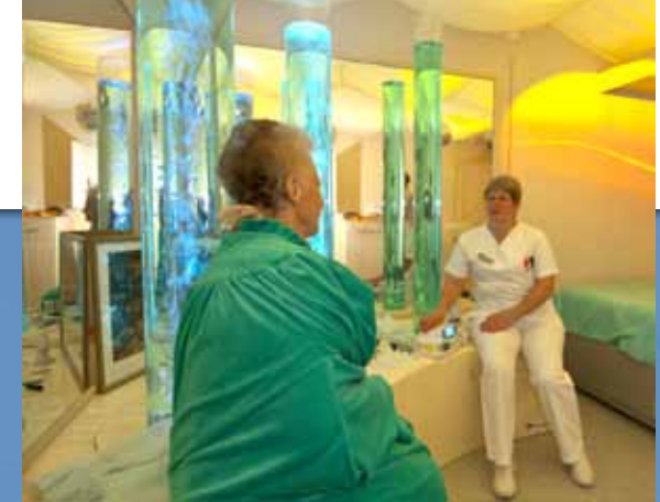
Der Snoezelraum bietet den Patienten Ruhe und Entspannung.

An erster Stelle steht der offene und herzliche Umgang mit den Patienten und deren Angehörigen. Sorgen und Nöte werden respektvoll und dennoch offen angesprochen.